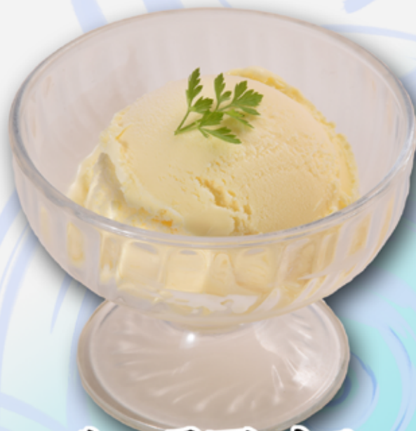
バナラアイス 350円(税込385円)