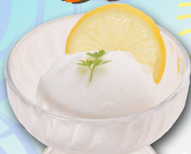
レモンシャーベット 350円(税込385円)